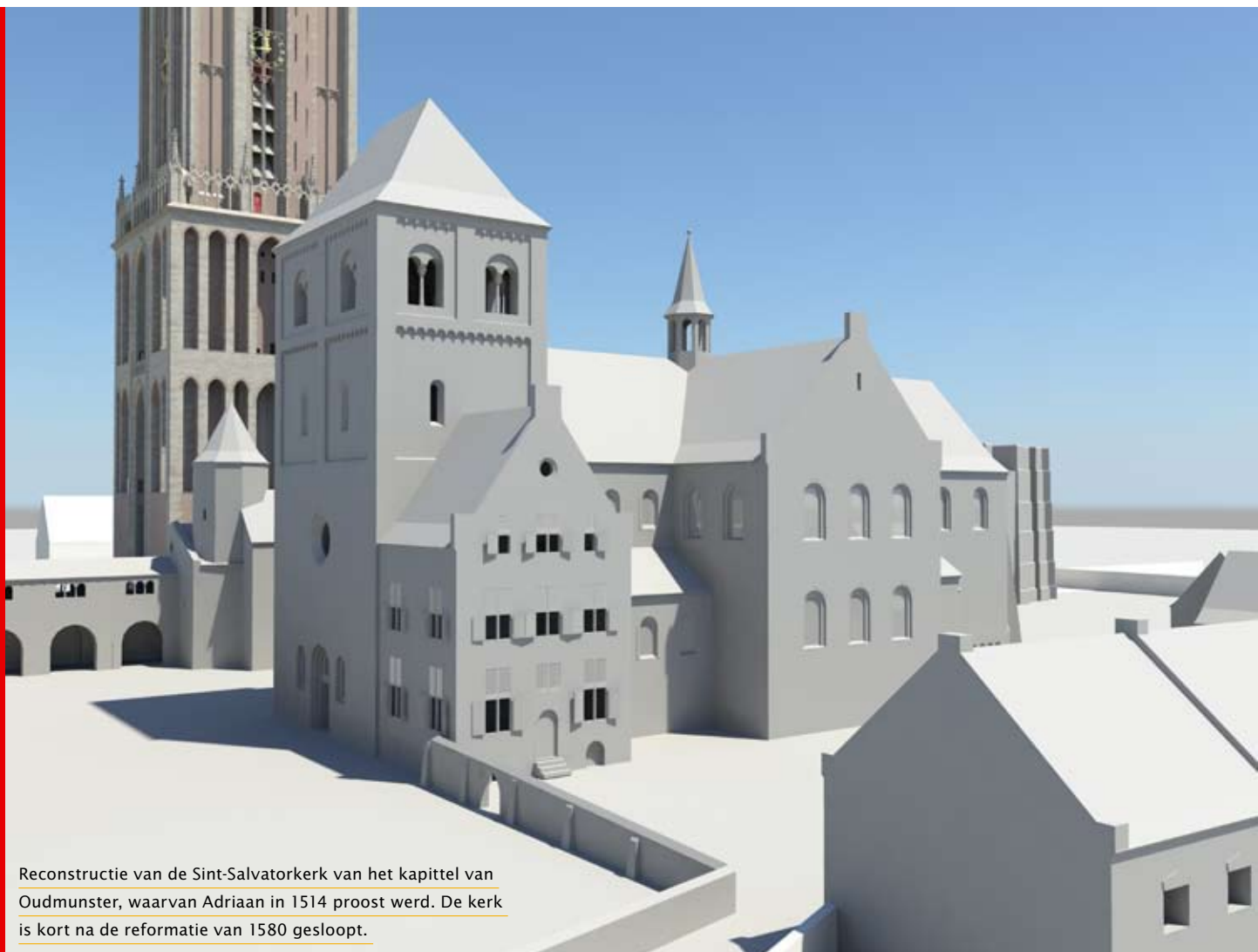
Reconstructie van de Sint-Salvatorkerk van het kapittel van Oudmunster, waarvan Adriaan in 1514 proost werd. De kerk is kort na de reformatie van 1580 gesloopt.