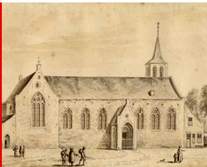
Het is goed mogelijk dat de jonge Adriaan, die woonde aan de Oudegracht, naar de Geertekerk ging. De Geertekerk was in de vijftiende eeuw een van de vier parochiekerken in de stad. Aan te nemen valt dat hij, samen met Herman van Lokhorst, ook op de Geerteschool zat. Tekening van A. Rademaker uit 1724.