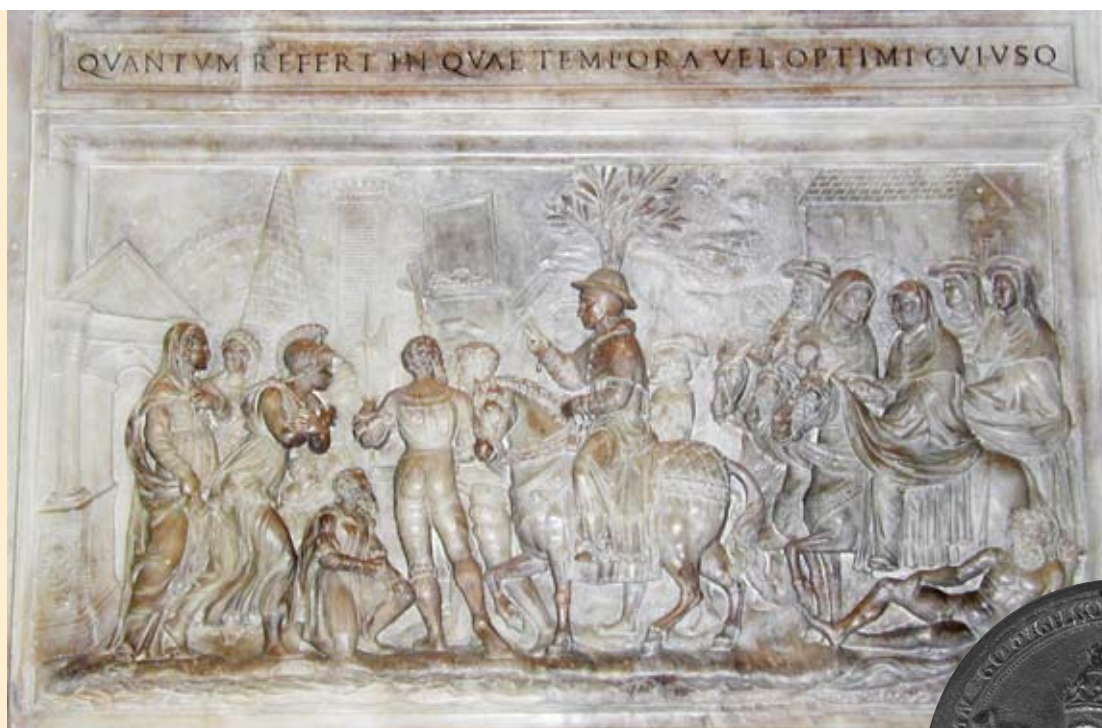
De intocht van Adrianus VI in Rome op 28 augustus 1522, zoals afgebeeld op zijn grafmonument in de Santa Maria dell'Anima.