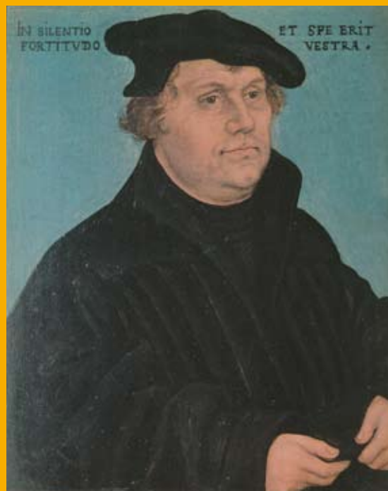
Maarten Luther. Schilderij van Lucas Cranach uit 1532.