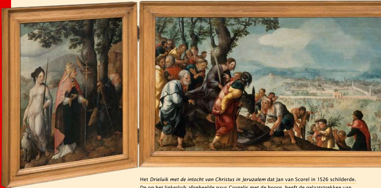
Het Drieluik met de intocht van Christus in Jeruzalem dat Jan van Scorel in 1526 schilderde. De op het linkerluik afgebeelde paus Cornelius met de hoorn, heeft de gelaatstrekken van Adrianus VI meegekregen.

maar tijdens een verbouwing in de jaren vijftig kwam een deel van de kerkmuur weer tevoorschijn. Tijdens recent bouwhistorisch onderzoek zijn er opnieuw belangrijke restanten uit het abdijverleden ontdekt, zoals een dertiende-eeuwse spitsboog en een onderaardse gang uit de vijftiende eeuw. Deze bijzondere vondsten zijn nu onderdeel van de museale opstelling van het bezoekerscentrum van Het Utrechts Archief, dat in 2008 haar deuren heeft geopend.