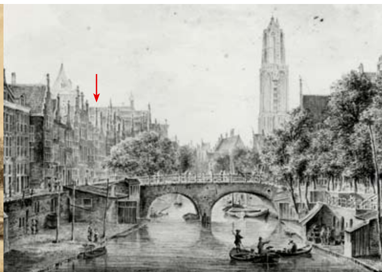
De Oudegracht in 1759. Links – onder het pijltje – staat het geboortehuis van Adriaan van Utrecht. Tekening J. Versteegh.

Geertebrug, kregen een eervolle vermelding. En om dat te benadrukken werd er door het stadsbestuur bij deze vier bruggen ‘elck noch een vat byer’ afgeleverd.