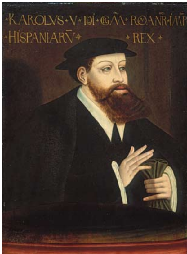
In 1507 werd Adriaan door Maximiliaan van Oostenrijk benoemd tot de leermeester van Karel V (1500-1558). Vanaf 1509 zou Adriaan door het hofleven geheel in beslag worden genomen. In 1515 zou Adriaan naar Spanje gaan om de troonopvolging van Karel veilig te stellen. Dit portret van Karel V is van omstreeks 1540.

2 In 1515 werd Adriaan met een geheime missie naar Spanje gezonden om de aanspraken van Karel V op de Spaanse troon te verzekeren. Dat was nodig omdat de toenmalige koning Ferdinand II van Aragon zelf voorkeur had voor Ferdinand, de jongere broer van Karel. Adriaan slaagde wonderwel in zijn missie, zodat hij na de dood van Ferdinand van Aragon op 23 januari 1516 samen met de invloedrijke kardinaal Ximenes de Cisneros de belangen van Karel V waarnam. In maart 1516 riep Karel zichzelf tot koning van Spanje uit om pas een jaar