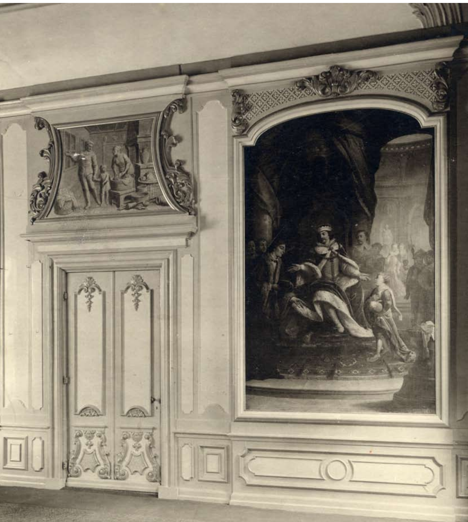
In het geboortehuis werd in de achttiende eeuw een 'Pausenkamer' ingericht met schilderijen die het leven van Adriaan verbeeldden. De schilderijen hangen tegenwoordig in Paushuizen.