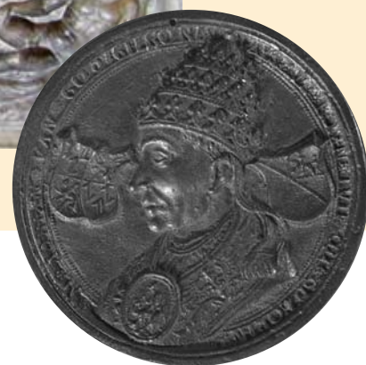
Gedenkpenning uit 1522 met paus Adrianus VI en links zijn eigen wapen en rechts het wapen van de stad Utrecht.

poorten van de stad. Toen Karel V in 1528 de macht in de stad overnam, verving hij de wapens van zijn vroegere leermeester door die van hemzelf.